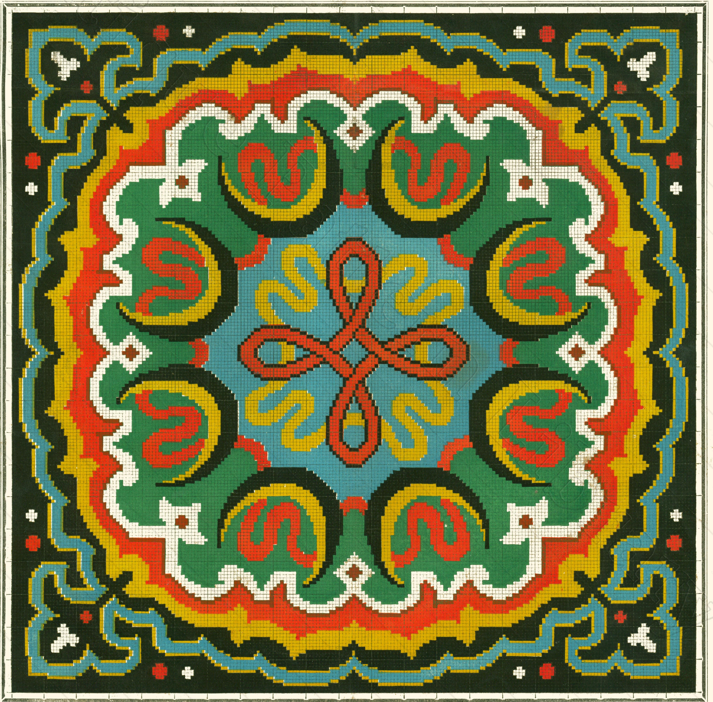
Planches et impression des Couleurs par les procédés typographiques d'Ernest Meyer, 5, rue de l'Abbaye, à Paris.